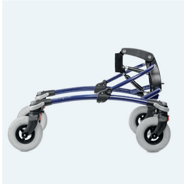
Tallas 2, 3 y 4 con ruedas grandes