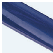
Talla 4 = azul