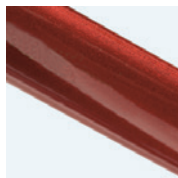
Talla 3 = rojo