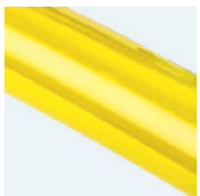
Talla 1 = amarillo