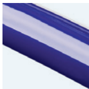
Talla 2 = azul