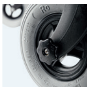
Freno de fricción