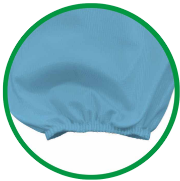
Puño elástico con goma interior